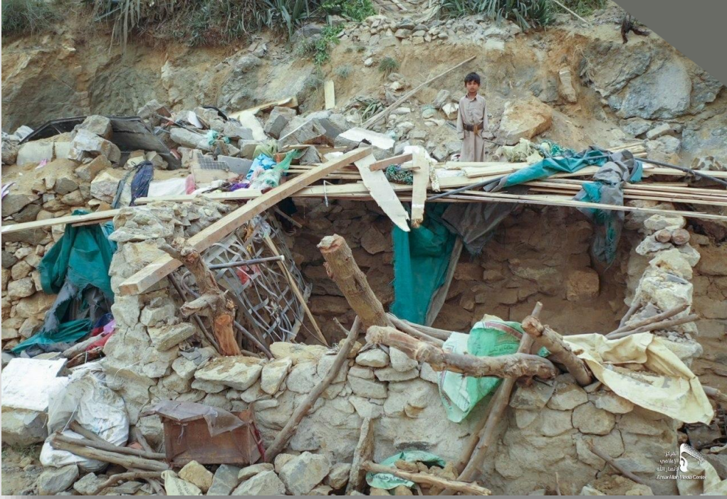
صورة لآثار الدمار الذي خلفه قصف التحالف لمنزل أسرة آل مجلي