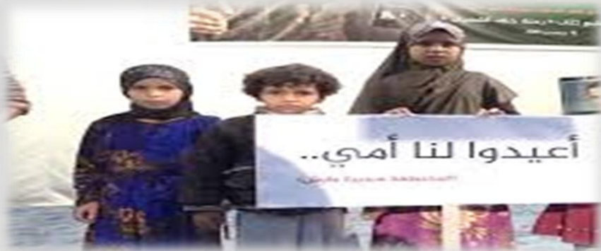
صورة لأبناء المختطفة يطالبون فيها بالإفراج عن أمهم

وقد أدانت واستنكرت الأحزاب السياسية ومنظمات المجتمع المدني جريمة اختطاف واحتجاز المواطنة (س.ح.م) وكل الانتهاكات بحق النساء اليمنيات من قبل العدوان ومرتزقته، كما أقيمت العديد من الوقفات الاحتجاجية التي نددت بجرائم وانتهاكات العدوان بحق نساء اليمن وطالبت بتقديم مرتكبي هذه الجرائم للعدالة.