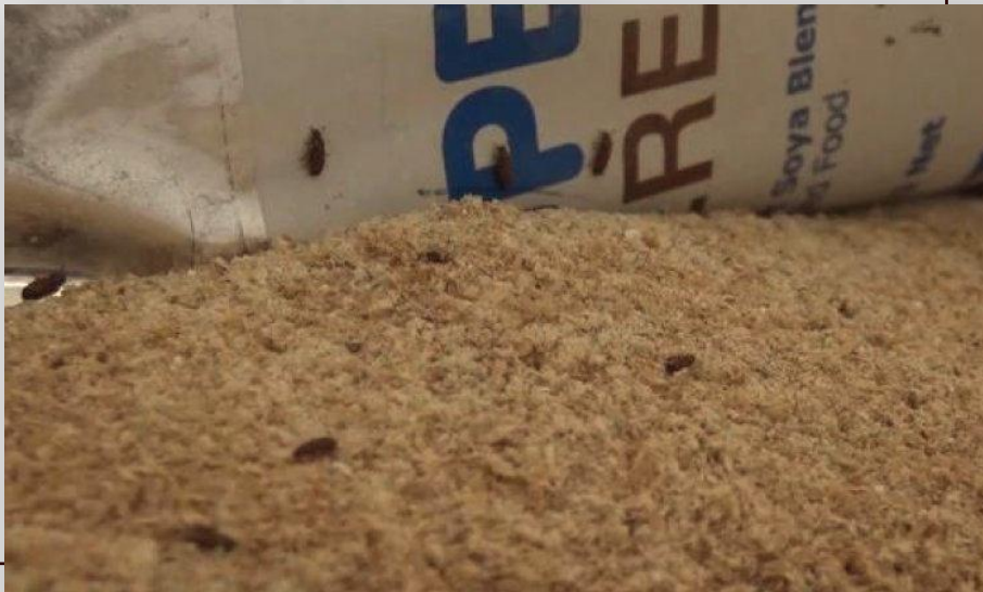
مساعادات فاسدة وملينة بالحشرات وغير قابلة للاستخدام

يشكو المدنيون في اليمن من تفاقم وضعهم الإنساني مع تقاعس كل المنظمات الإنسانية وعلى رأسها الأمم المتحدة تجاه ما يتعرضون له، حيث يحصلون على المساعدات والإغاثات منتهية الصلاحية، فأحدى النساء في مديرية الدريهمي تحكي عن تلقيها سلة غذائية تحوي دقيقا فاسدا وتشتكي من عدم توفر المأكل والمشرب، وتضيف: "ضاق الوضع بنا، ونحن على أمل أن يفك الحصار وأن تضغط الأمم المتحدة على مرتزقة العدوان من التضييق ومنع دخول أي شيء إلينا"، لكن يبدو أن لا جدوى من ذلك.