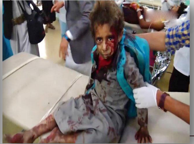
ضحايا قتلى وجرحى من أطفال الحافلة

ومن الصور المأساوية التي لحقت بالقطاع التعليمي، ما حدث من استهداف لمدرسة الراعي للبنات داخل مدرسة سعوان بأمانة العاصمة في ٧ إبريل ٢٠١٩، حيث نفذ طيران العدوان غاراتٍ قريبة جداً من المدرسة، محدثاً حالةً من الخوف والرعب لدى الطالبات اللواتي تدافعن أثناء الهروب، ما أدى إلى مقتل ١٤ مدنياً بينهم ١٣ طالبة، وأصيب ١٠٩ مدنياً معظمهم من الطالبات.