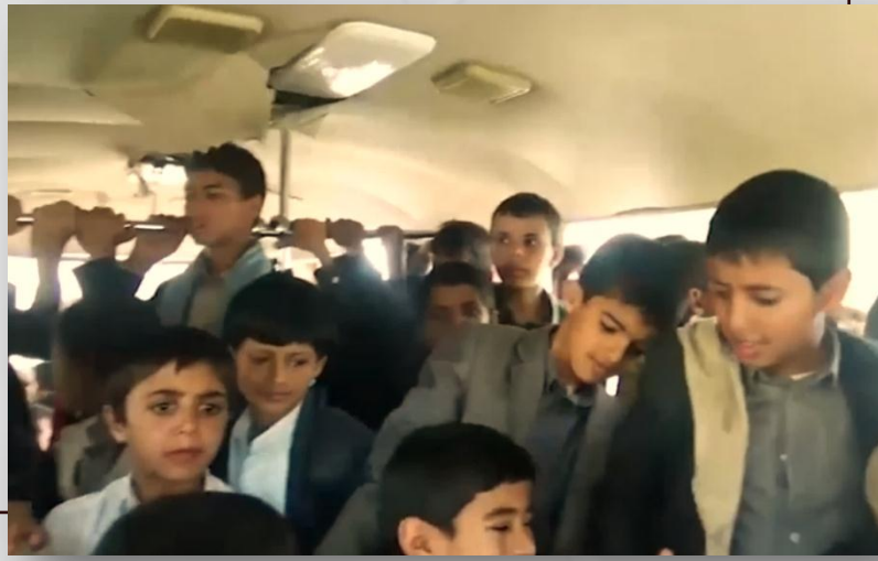
صورة للأطفال في الحافلة قبل الاستهداف