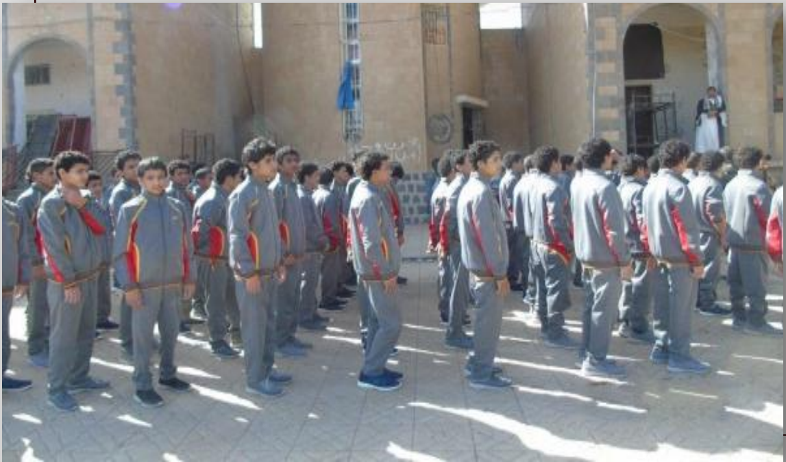
صور الأطفال الأسرى الذين جندتهم قوى العدوان