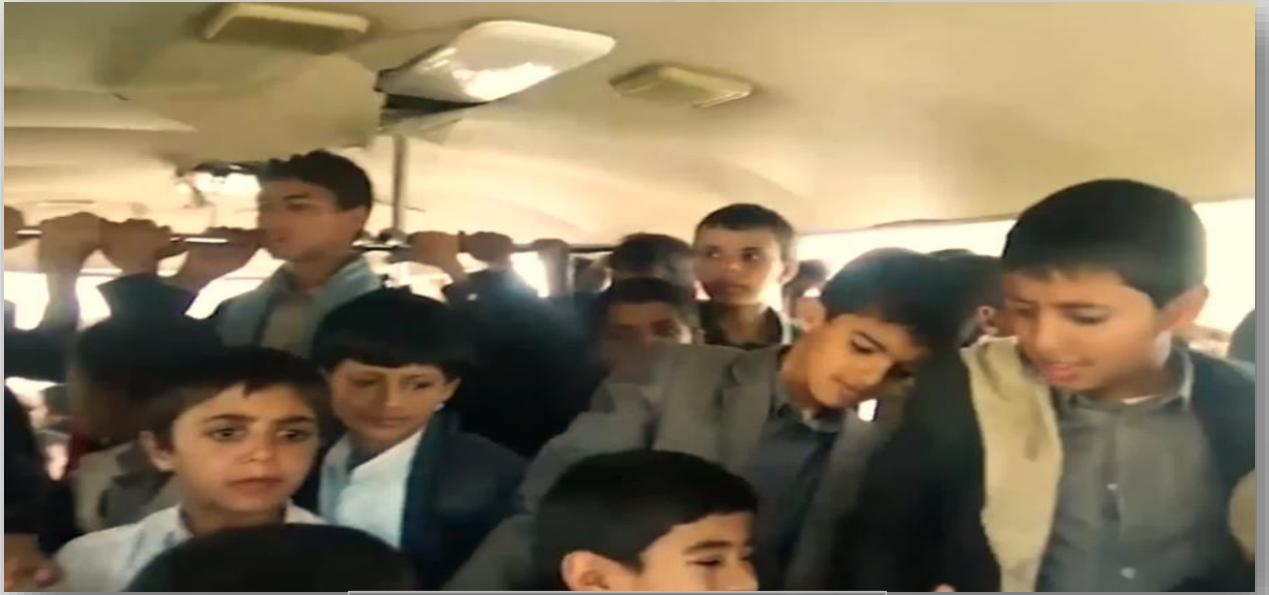
صورة للأطفال في الحافلة قبل الاستهداف