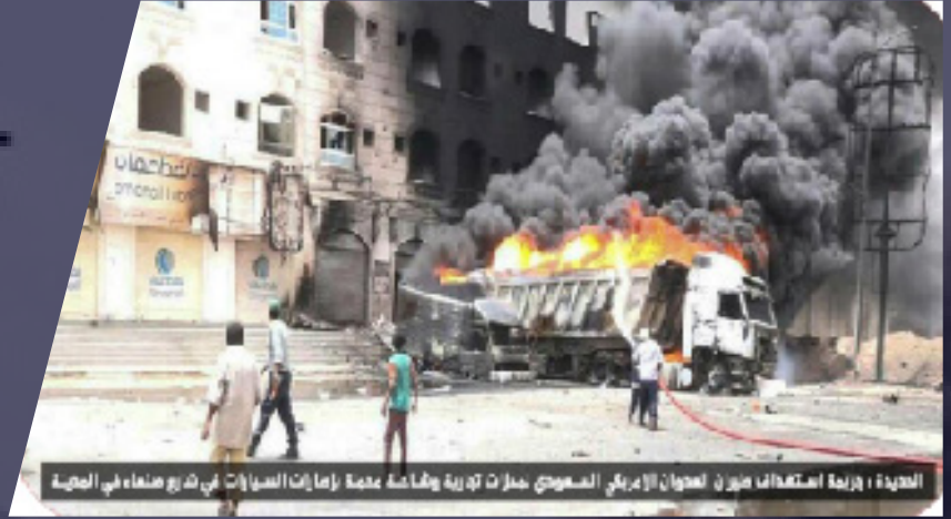
الحديدة : هزيمة انتصاف ميرور العدوان الإرهابي المصونج بمدارات تدمرية وشماكة عمدة إمارات الصواريخ في شارع صنعاء في الحديدة