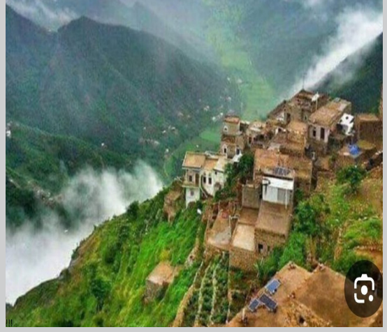
مديرية بلاد الطعام

هي إحدى المديريات التابعة لمحافظة ريمة ، بلغ عدد سكانها ٣١١٤٣ نسمة حسب إحصاء عام ٢٠٠٤ م .