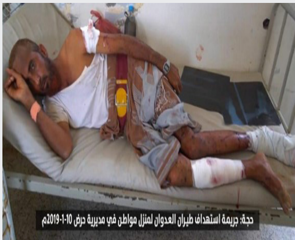
حجة: جريمة استهداف طيران العدوان لمنزل مواطن في مديرية حرض 1-10-2019م