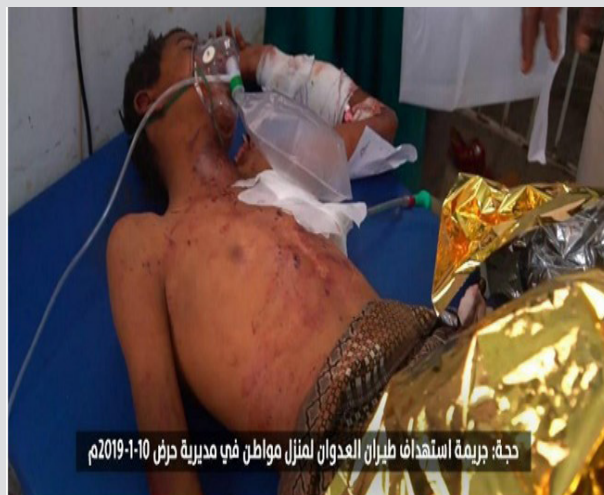
حجة: جريمة استهداف طيران العدوان لمنزل مواطن في مديرية حرض 1-10-2019م