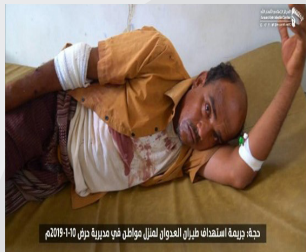
حجة: جريمة استهداف طيران العدوان لمنزل مواطن في مديرية حرض 1-10-2019م